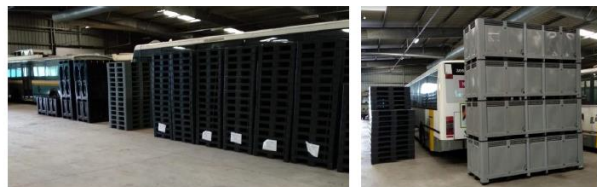
Pallets in kunststof en nieuwe palletboxen werden geleverd