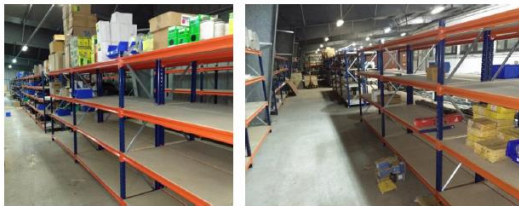
Magazijnrekken voor onderdelen autobussen zijn geplaatst

De coronabeperkingen zorgden er ook hier voor dat de werken minder snel opschoten dan verwacht. Naar de toekomst toe wenst vzw META een huurovereenkomst op langere termijn met de gemeente af te sluiten.